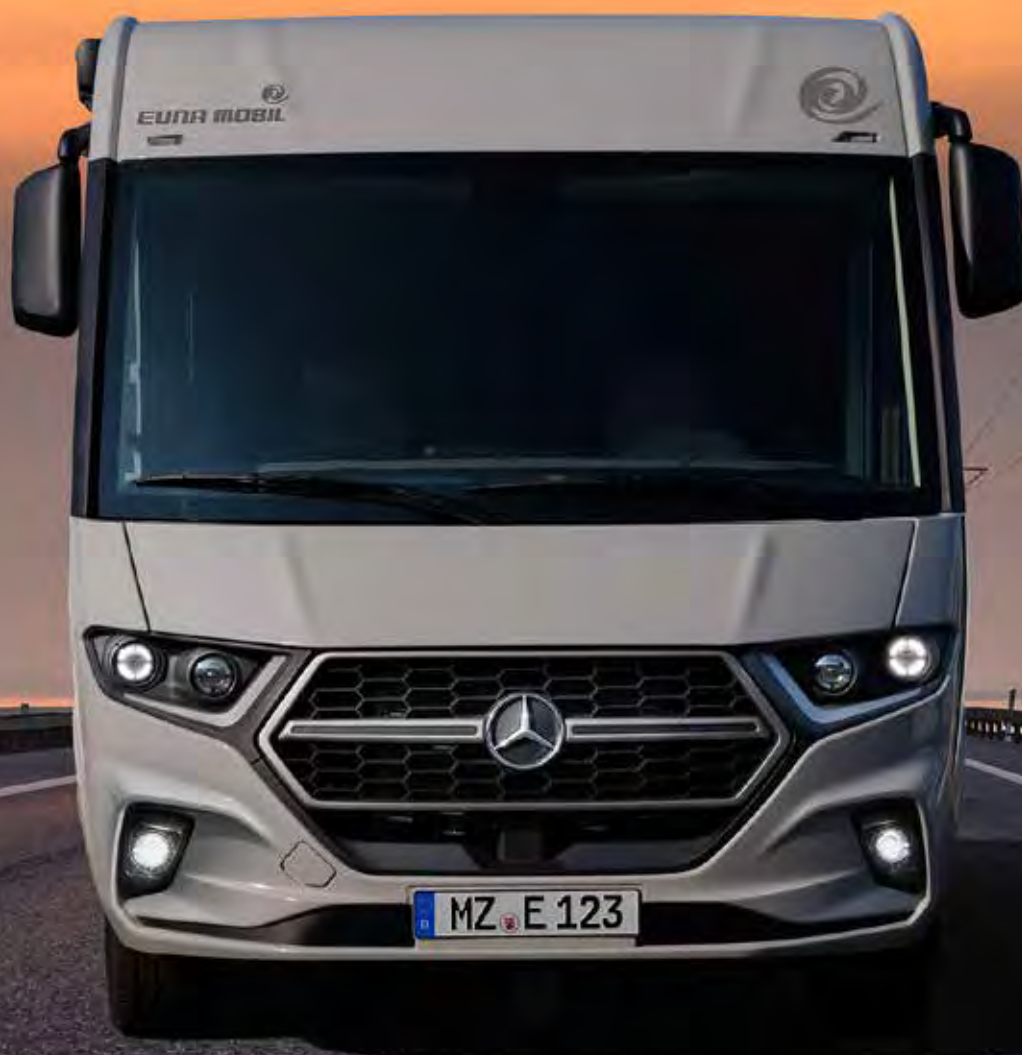
Abbildung mit Individualausstattung