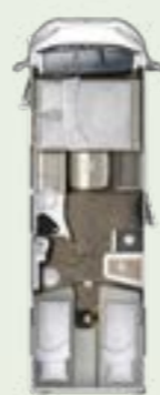
IL 720 EF