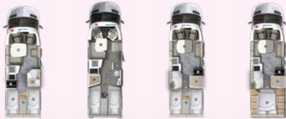
PT 696 EB