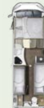
IL 730 EF