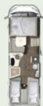
IL 720 EB