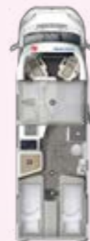
PRS 720 EB