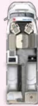
PT 730 EF