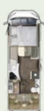
IL 695 LF