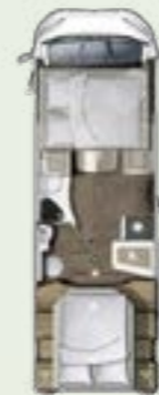
IL 720 QF