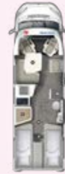
PT 720 EB