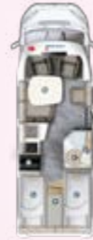
PT 695 EB