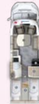
PRS 720 EF