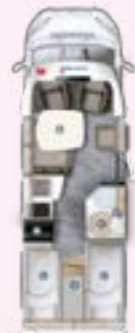
PRS 695 EB