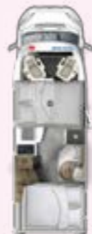
PRS 695 HB