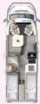
PT 660 EB