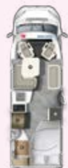
PRS 675 SB