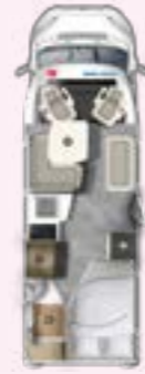
PT 675 SB