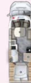
PRS 720 QF