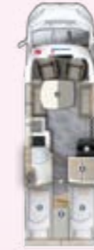
PT 720 EF