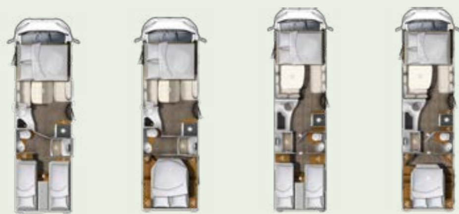
I 760 EF