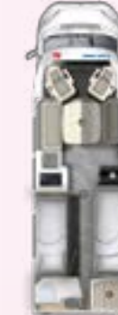
PRS 730 EF