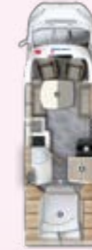
PT 720 QF