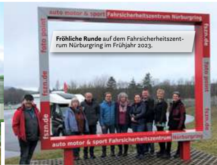
Fröhliche Runde auf dem Fahrsicherheitszentrum Nürburgring im Frühjahr 2023.