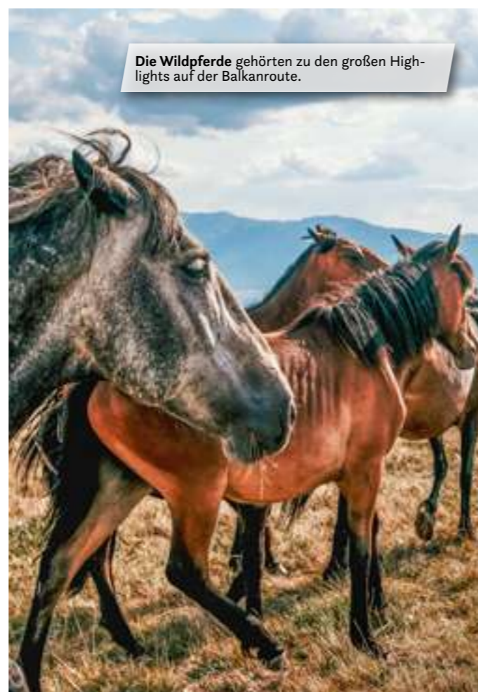
Die Wildpferde gehören zu den großen Highlights auf der Balkanroute.

Die Wildpferde in Bosnien und Herzegowina zu sehen, gehörte unseren großen Highlights auf der Balkanroute. Da wir „nur“ mit einem normalen Wohnmobil und nicht mit einem 4x4 Fahrzeug unterwegs sind, wurde uns leider schnell klar, dass wir es nicht bis zu den Wildpferden in Bosnien und Herzegowina schaffen werden. Aber zum Glück gibt es tolle Touren, die man buchen