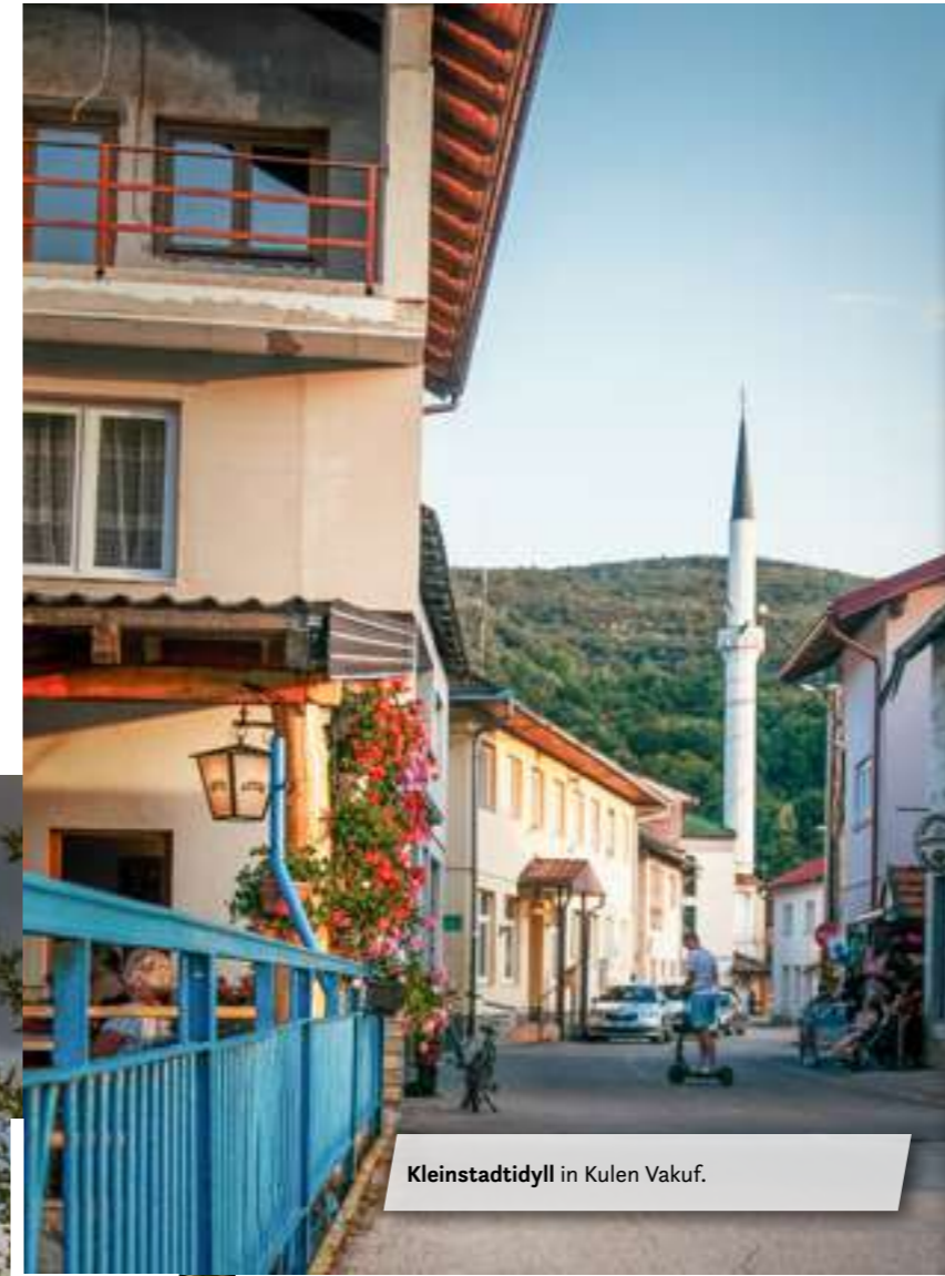
Kleinstadtidyll in Kulen Vakuf.

Anschließend sind wir auf spektakulären Landstrassen zu einem weiteren Stellplatz mit tollem Bergpanorama im Hintergrund gefahren. Der See selbst ist recht flach, aber baden ist möglich. Es können hier schöne Wanderungen rund um den See unternommen werden. Für die Kinder gibt es eine Schaukel, eine Sandkiste und ein Trampolin. Der Platz verfügt über einen Gasgrill und eine Küche, die benutzt werden darf. Im Kühlschrank stehen auch kalte