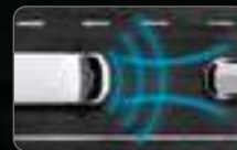
TRAFFIC JAM ASSIST