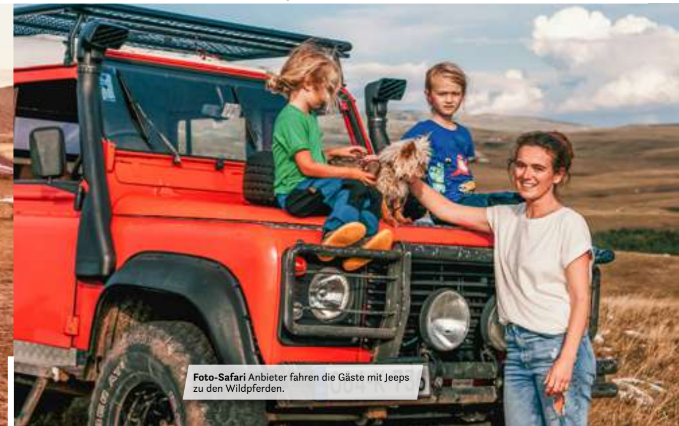
Foto-Safari Anbieter fahren die Gäste mit Jeeps zu den Wildpferden.