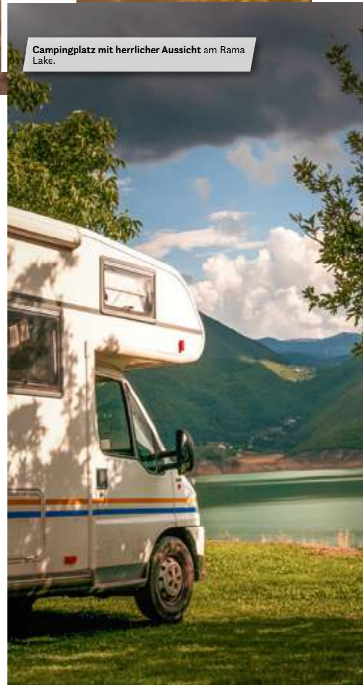
Campingplatz mit herrlicher Aussicht am Rama Lake.