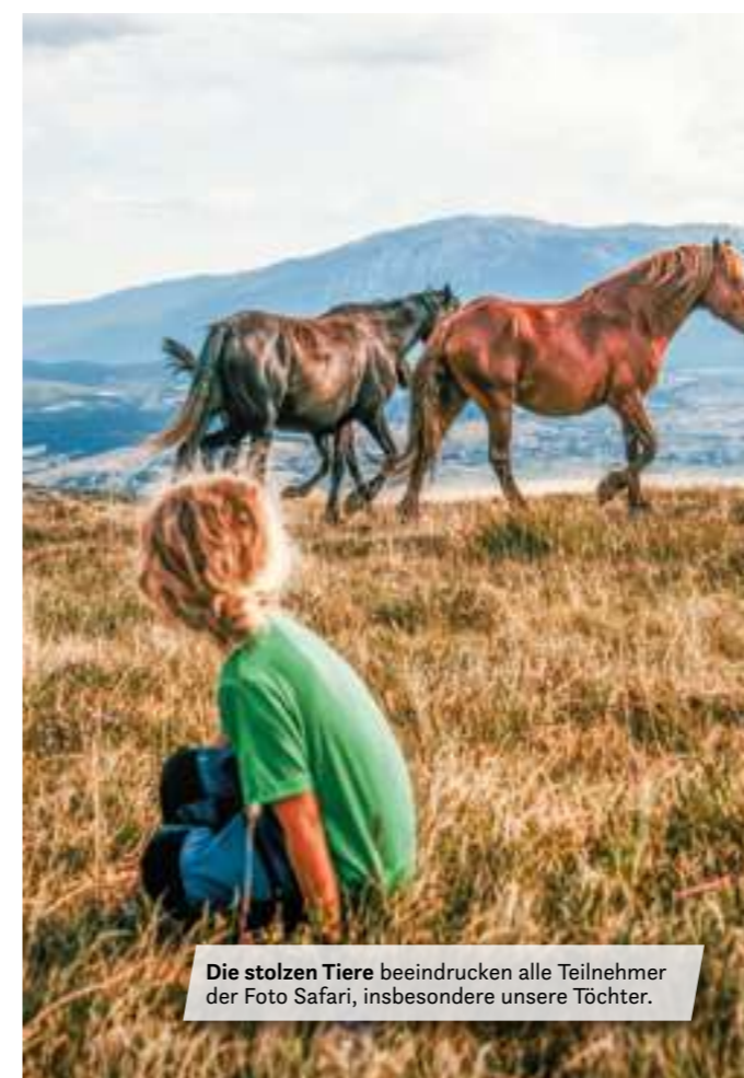
Die stolzen Tiere beeindrucken alle Teilnehmer der Foto Safari, insbesondere unsere Töchter.

kann und die wir wirklich weiterempfehlen. Reisende mit einem (kleinen) offroadtauglichen 4x4 Fahrzeug können versuchen auf eigene Faust in die Hochebene bei Livno zu fahren und dort die Wildpferde zu suchen. Bedenken sollte man dabei aber, dass aus dem Krieg immer noch abseits der Wege Munitionsüberreste herumliegen könnten. Ob das in dieser Region heute noch ein Problem darstellt, sollte vorab geklärt werden.