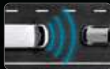
ADAPTIVE CRUISE CONTROL