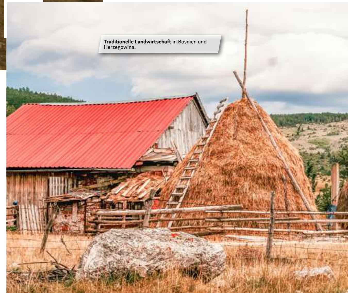
Traditionelle Landwirtschaft in Bosnien und Herzegowina.

Der Ort Martins Brod liegt direkt an den "Great Una Waterfalls" und ist daher perfekt geeignet, um diese zu besichtigen. Darüber hinaus kann man hier eine schöne Wanderung zu einem Canyon machen. Der Weg führt auch durch einen Tunnel, in dem ihr mit Glück Fledermäuse sehen könnt (nicht zu nah ran gehen, Fledermäuse können Tollwut übertragen).