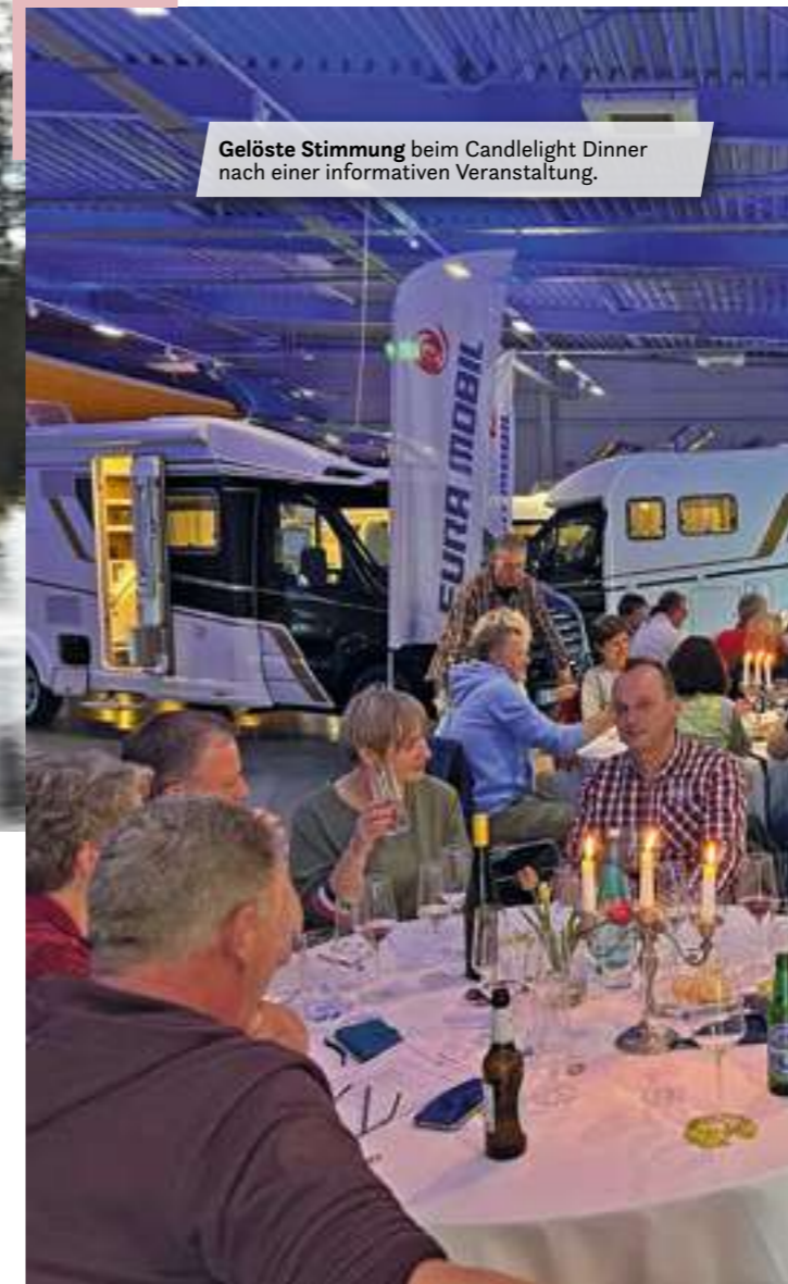
Gelöste Stimmung beim Candlelight Dinner nach einer informativen Veranstaltung.