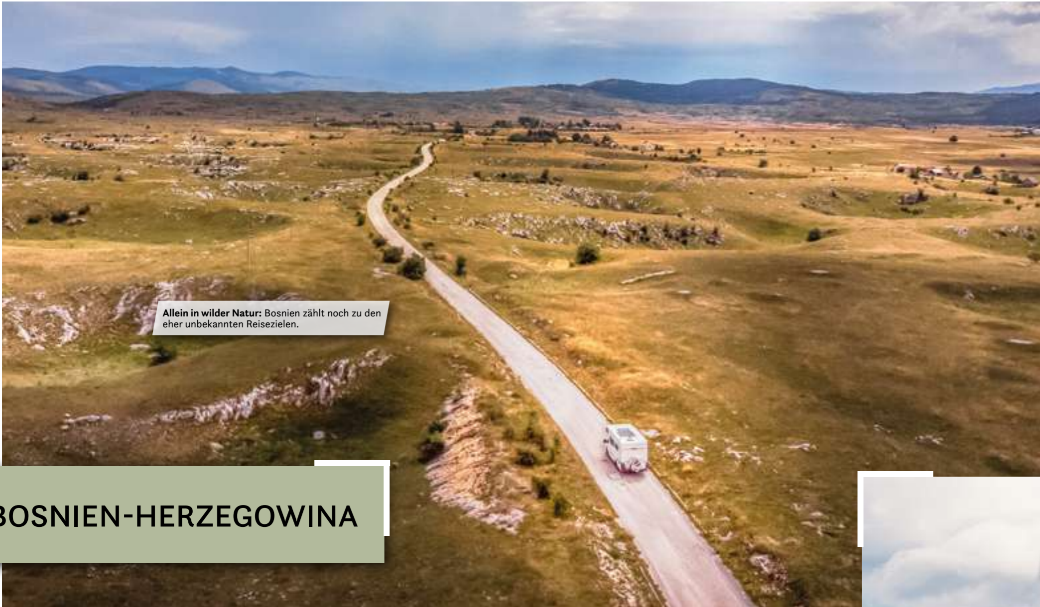
Allein in wilder Natur: Bosnien zählt noch zu den eher unbekannteren Reisezielen.