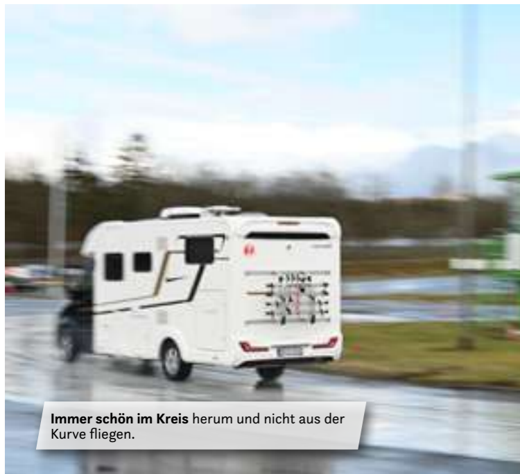
Immer schön im Kreis herum und nicht aus der Kurve fliegen.

Und auch im Jahr 2024 ergibt sich sicher wieder die Möglichkeit einer Teilnahme. Denn auch in Zukunft möchten Eura Mobil und Forster dieses Fahrsicherheitstraining für Reisemobilistinnen anbieten.