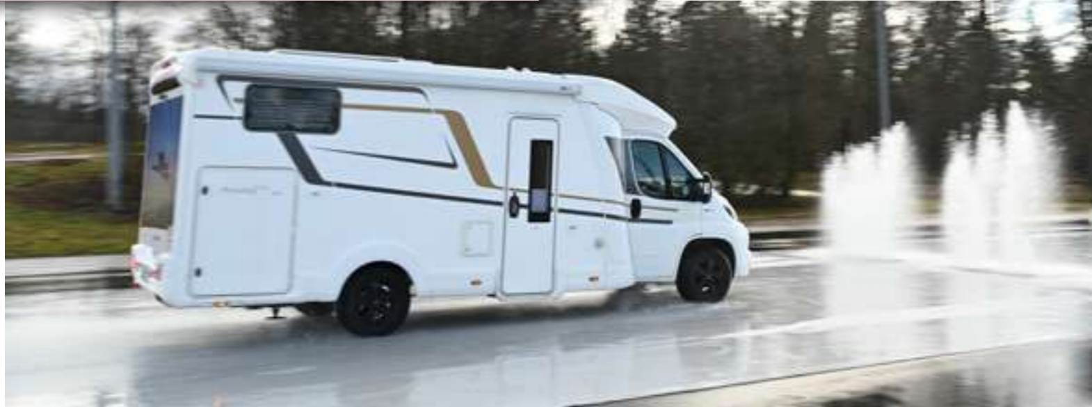
Bremsen vor auftauchenden Hindernissen ist eine Standardübung im Fahrsicherheitstraining.