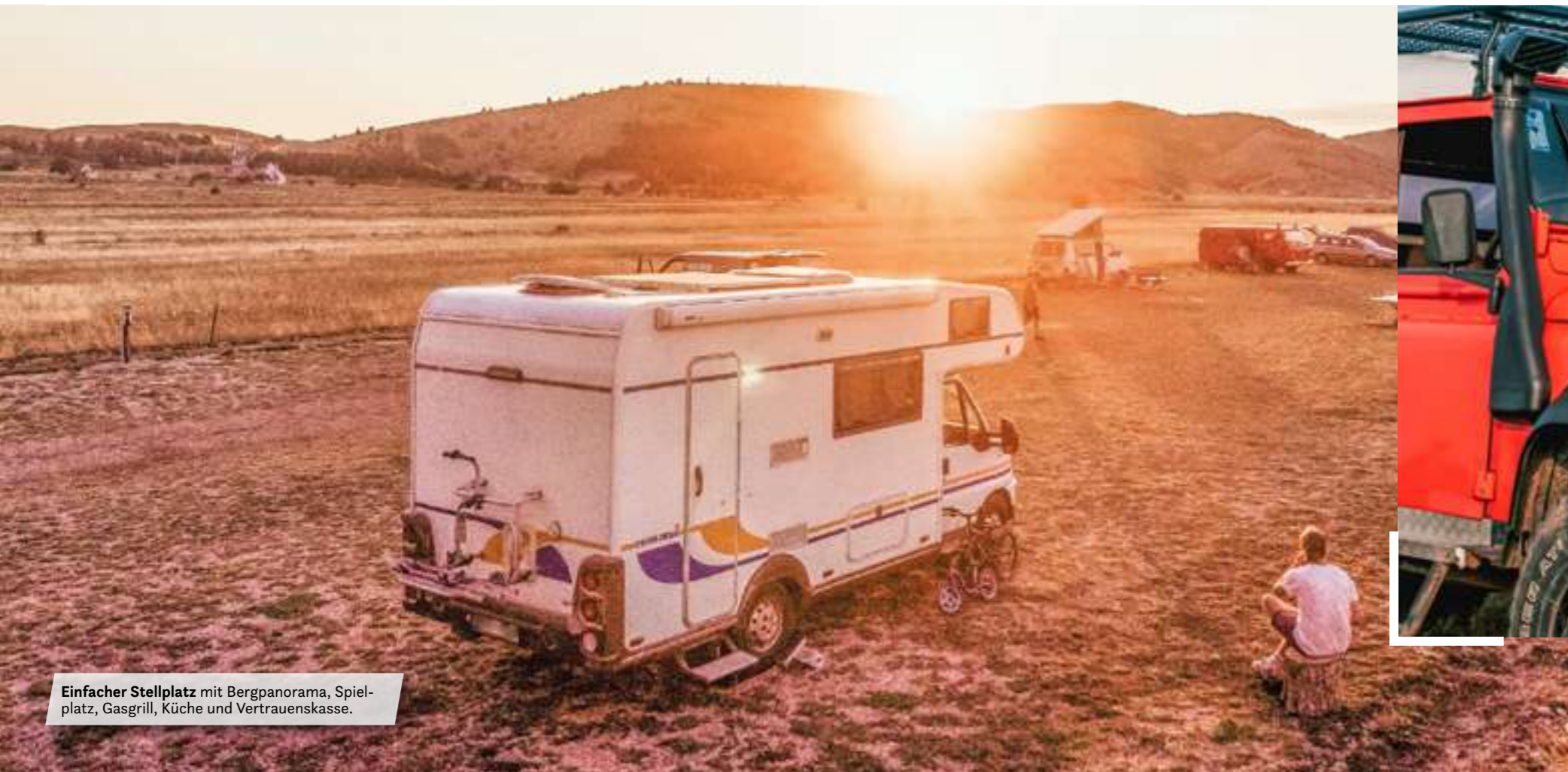
Einfacher Stellplatz mit Bergpanorama, Spielplatz, Gasgrill, Küche und Vertrauenskasse.