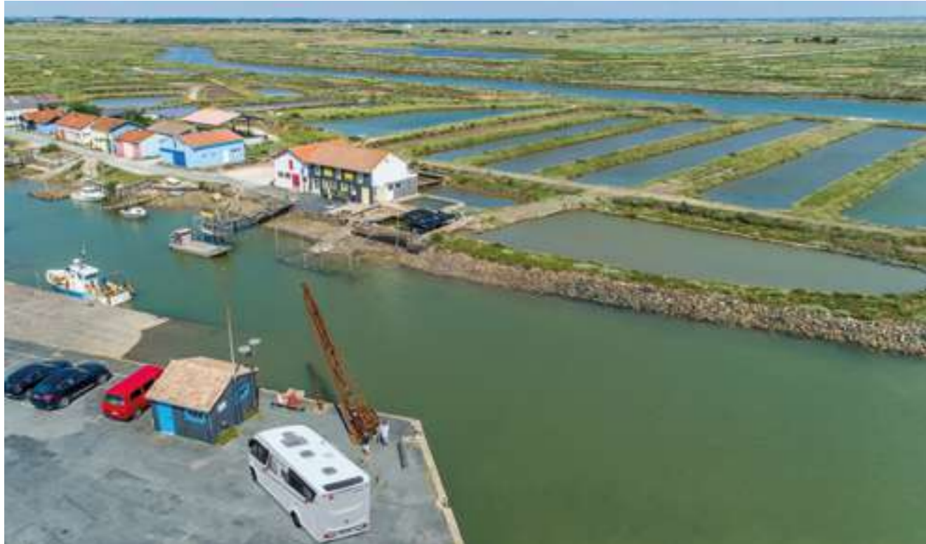
An den Verfeinerungsbecken der Austernzüchter in Marennes.

Küste, bieten Leihstationen ein Brett samt Instruktor zum Lernen und Üben an. Hier sind auch Tretboote und Kajaks im Verleih. Die wellenlosen Seen eignen sich hervorragend für Familien mit kleinen Kindern, für die die Brandung des Atlantik noch zu wild ist. Wellenlos sind auch die Teiche, in denen die Austern gezüchtet werden. Von L'Arcachon-Océan aus geht es für uns nordwärts zur Gironde Mündung.