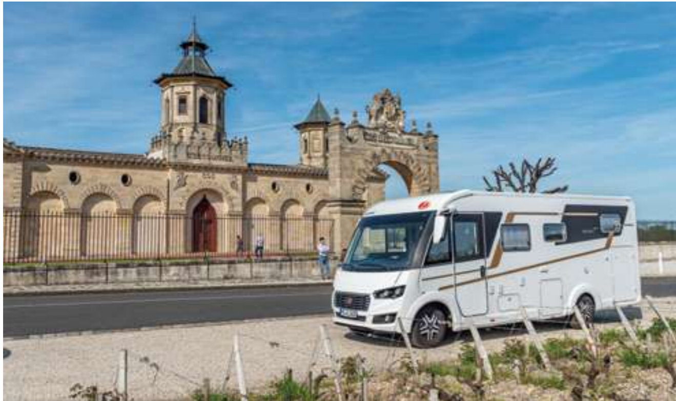
Das Weingut Cos d'Estournel direkt an der D2 mit seiner orientalisches inspirierten Architektur.

der Messe. Jede halbe Stunde fährt ein Bus zur nächsten Tramstation, mit der Straßenbahn ist das Zentrum in 10 Minuten zu erreichen. Mit dem Fahrrad sind es gerade einmal 8 km bis zur Oper im Herzen der Stadt. Aber auch das Umland mit den berühmten Weingütern des Médoc lässt sich von hier aus gut erkunden.