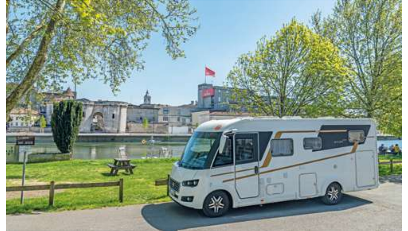
Blick auf das alte Hafentor und die weltberühmte Cognac Brennerei Hennessy.

In der Cité de l'Huitre in der Nähe von Marennes wird die Austernzucht für Groß und Klein anschaulich erklärt. Bei den Marennes-Oléron-Austern kommt es besonders auf die Verfeinerung an. Die rechteckigen Becken befinden sich in der seichten Gezeitenzone nahe der Mündung des Flusses Seudre etwas weiter im Inland. Hier wird neben dem Klären von Schlamm und Ablagerungen auch die Qualität der Austern erheblich verbessert. Die Nährstoffe im Verfeinerungsbecken werden durch die Gezeiten zugeführt. In manchen Claires setzen die Austernbauern 30 bis 40 Austern pro Quadratmeter aus. Nach zwei bis vier Wochen werden diese Austern als "Fines de Claires" deklariert. Sie sind nun fleischiger und geschmackvoller geworden. In anderen Claires werden hingegen nur etwa 5 bis 10 Austern pro Quadratmeter ausgesät. Diese dürfen dort zwei bis drei Monate verweilen. Letztlich entsteht eine außerordentlich fleischige und sehr schmackhafte Auster, die nun den Titel "Spéciale de Claires" tragen darf. Wie alle Lebensmittelproduzenten sind auch die Austernbauern des Marennes-Oléron auf ihre Produkte sehr stolz. In der Cité de l'Huitre werden daher die Austern nicht nur erklärt, sondern im integrierten Restaurant nach verschiedensten Rezepten frisch verarbeitet. Auch wir Neulinge müssen hier einfach probieren. Wo sonst, wenn nicht hier?