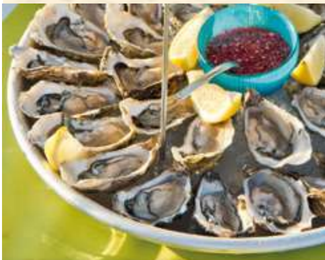
Hier lobt sich die Austern Verkostung. Frischer geht es nicht.

Nach einer kurzen Überfahrt mit der Fähre nach Royan erreichen wir die bei weitem größte Austern-Produktion Europas: Die weltberühmte Austernzucht-Region Ma-