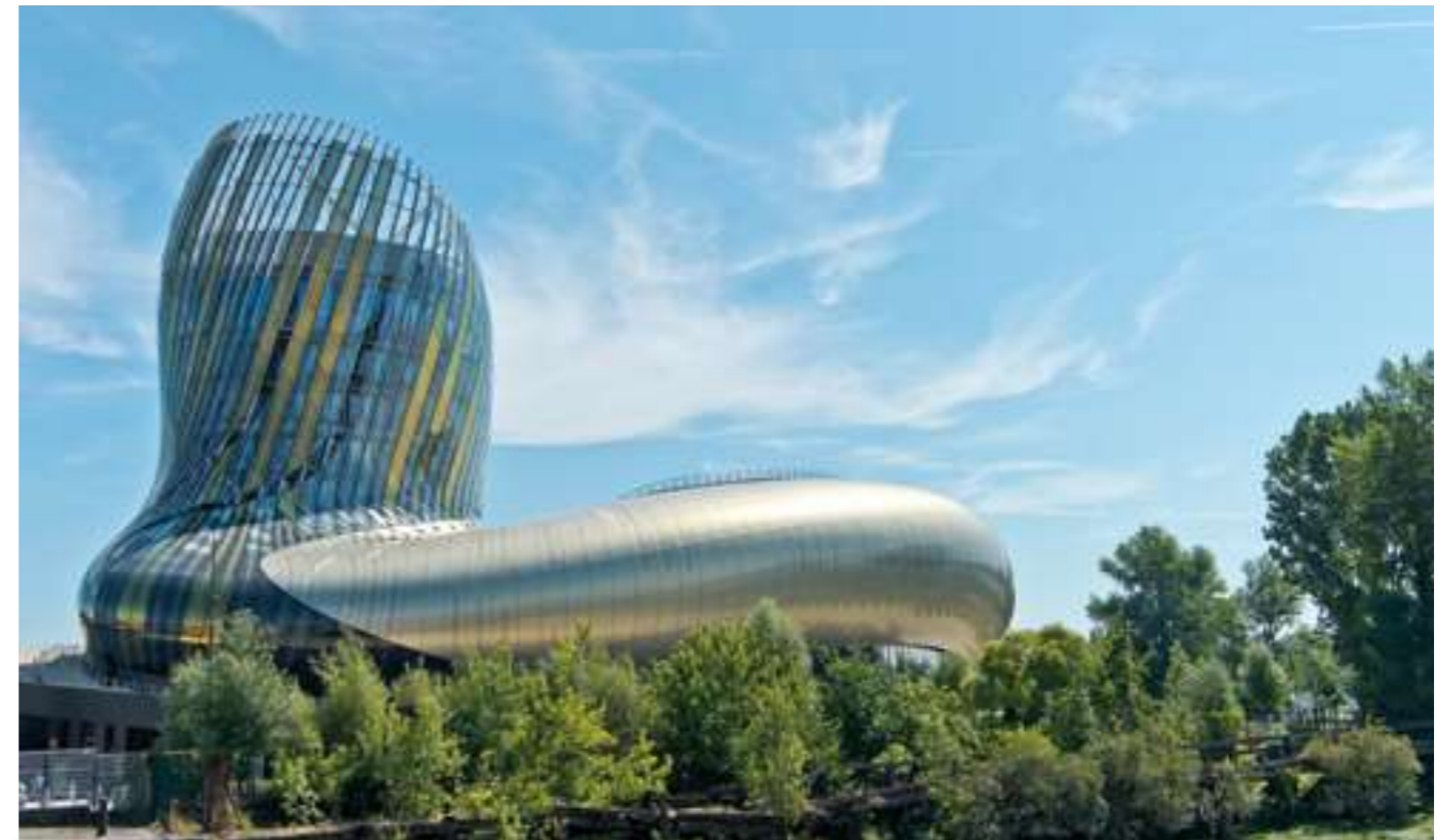
Gelungene Mischung aus Information und Unterhaltung: Die Cité du Vin in Bordeaux.

und Weinbars sind beliebte Treffpunkte der Bordelaiser. Daran angrenzend findet sich die mondäne Shoppingmeile zwischen Oper und Place Gambetta mit all den großen Modemarken und Weinhandlungen, in denen gegen entsprechendes Entgelt von bis zu 50 Euro pro Gläschen auch die ganz großen Châteaux zur Verkostung stehen.