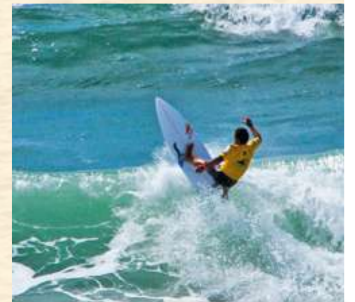
Lacanau-Océan ist ein Paradies für Wellenreiter und solche, die es werden wollen.

Ebenfalls auf dem Wasser und weitaus gemütlicher als Wellenreiten ist Stand-Up-Paddling auf den Seen im Hinterland. In Le Moutchic, nur wenige Kilometer hinter der