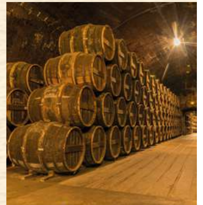
In den Kellern des Königsschlusses reift der Cognac von Baron Otard.

Flussufer gegenüber des Königsschlusses. Tags drauf geht es in einem Rutsch Richtung Heimat. Bordeaux, Paulliac, Lacanau-Océan, Marennes und Cognac sind nur fünf der zahlreichen Facetten der Region. Natürlich gibt es noch die Dune de Pyla, das Bassin d'Arcachon, den berühmten Weinort St. Emilion und zahlreiche weitere Attraktionen zu entdecken. All das sind viele gute Gründe, um immer wieder in Frankreichs Südwesten zu reisen. Also dann: À la prochaine! Bis zum nächsten Mal!