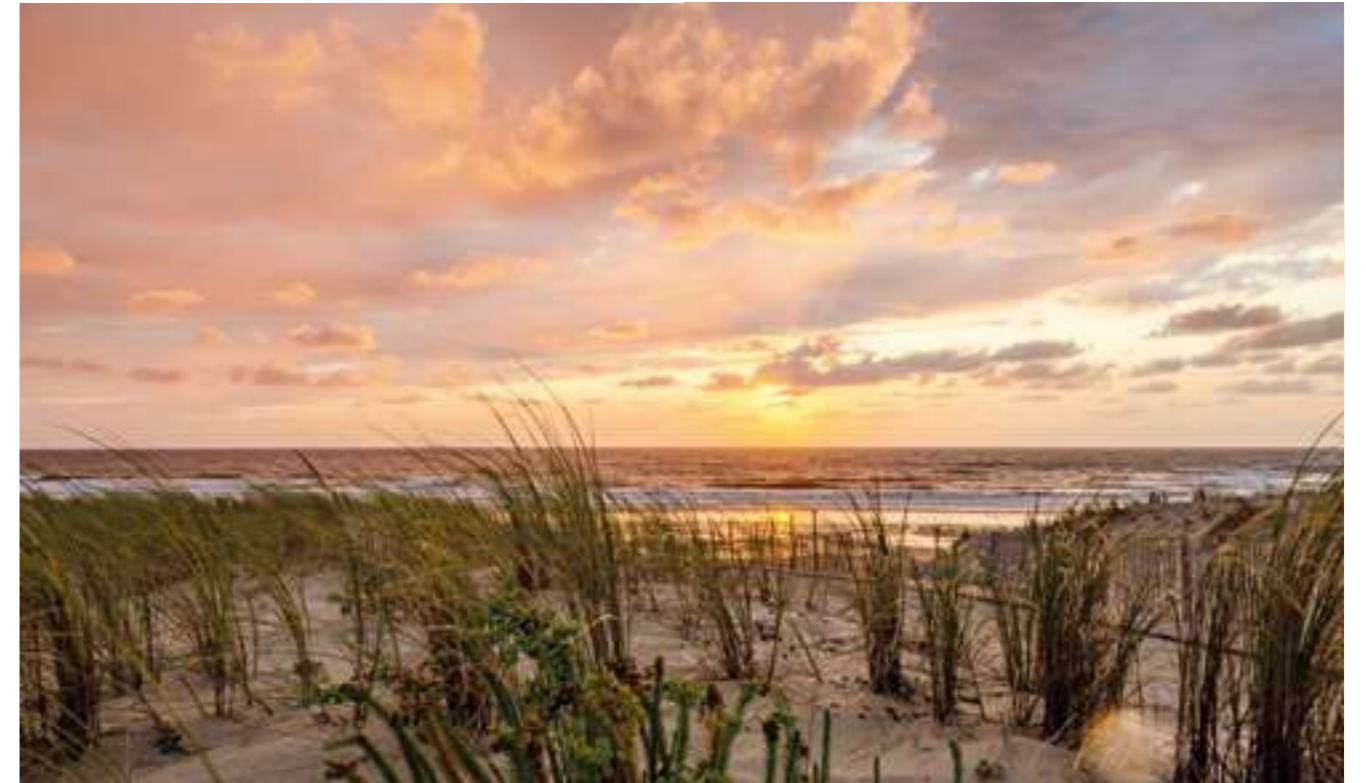
Allabendliches Lichtspiel: Der Sonnenuntergang am Strand von Lacanau-Océan.

die gesamte Atlantikküste zwischen Bretagne und Pyrenäen entlang verläuft. Mitten an der Küste des Médoc kreuzt die Vélodyssée auch den Ort Lacanau-Océan, unseren zweiten Halt in der Region. Breite, gut asphaltierte Radwege verlaufen parallel zum Meer durch die Pinienwälder hinter der Düne. Die Steigungen sind meist nur kurz oder sanft. Umgeben vom Duft der Pinien und dem Zirpen der Zikaden lassen sich hier herrliche Radtouren machen.