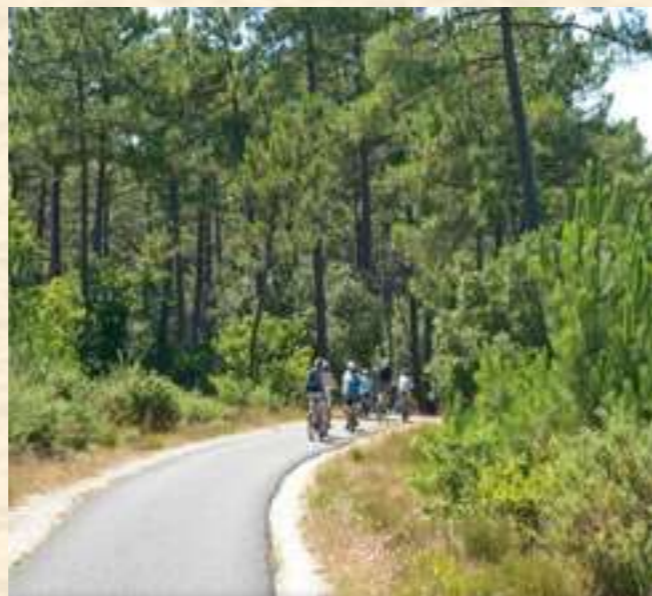
Gut ausgebaute Radwege durch Pinienwälder säumen die Küstenlinie des Médoc.

Radfahren lohnt sich auch an der Atlantikküste. Mit der Vélodyssée hat Frankreich einen Radweg geschaffen, der