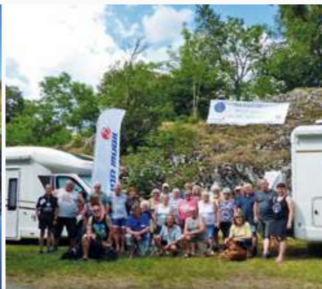
Fröhliche Runde auf dem Harzer Eura Mobil Club Treffen im Juni 2022.