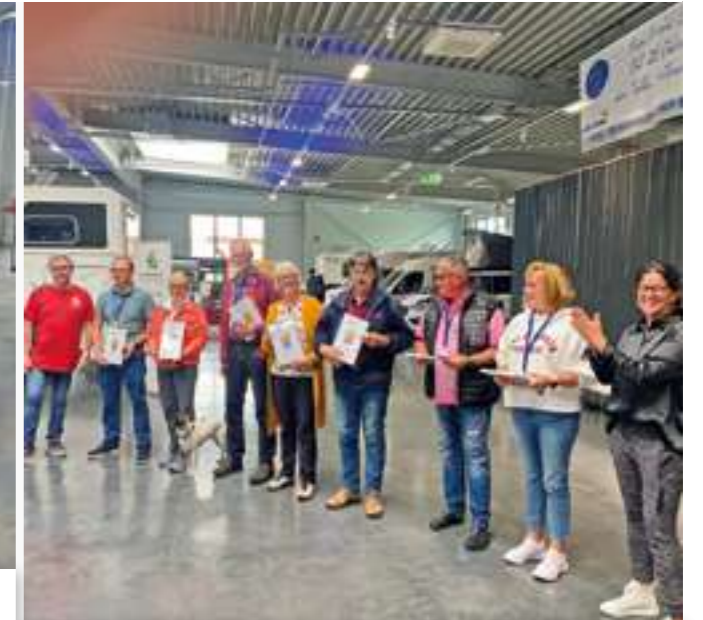
Ehrung der langjährigen Mitglieder des Eura Mobil Clubs.