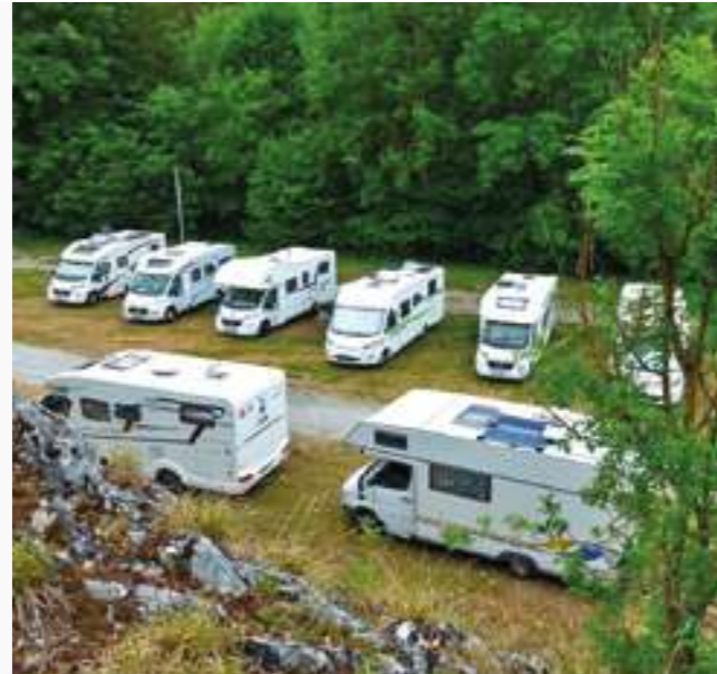
Sauber aufgereiht stehen die Eura Mobile auf dem Schützenplatz in Rübeland.

Tags drauf ging es zur Wendefurth Talsperre und einer Floßfahrt auf der Rappbodetalsperre. Hier gibt es Europas längste Hängeseilbrücke, einen Gigaswing, die Mega Zipline und als neueste Attraktion einen spektakulären Aussichtsturm. Passend zum Element Wasser auf dem wurde zum Mittagstisch eine frisch geräucherte Forelle mit Salatbeilage gereicht. Die Gruppe erlebte eine genussvolle Zeit für Gaumen und Augen mit wunderschönen Impressionen. Im Anschluss daran gab Busfahrer Uwe während der Rückfahrt einen informativen Reisebericht zu den Sehenswürdigkeiten entlang der Strecke. Einige nutzten die Gelegenheit, um die mit 108 Metern höchste Staumauer Deutschlands zu besichtigen. Andere interessierten sich für die Schauhöhlen und nahmen an einer Führung in der