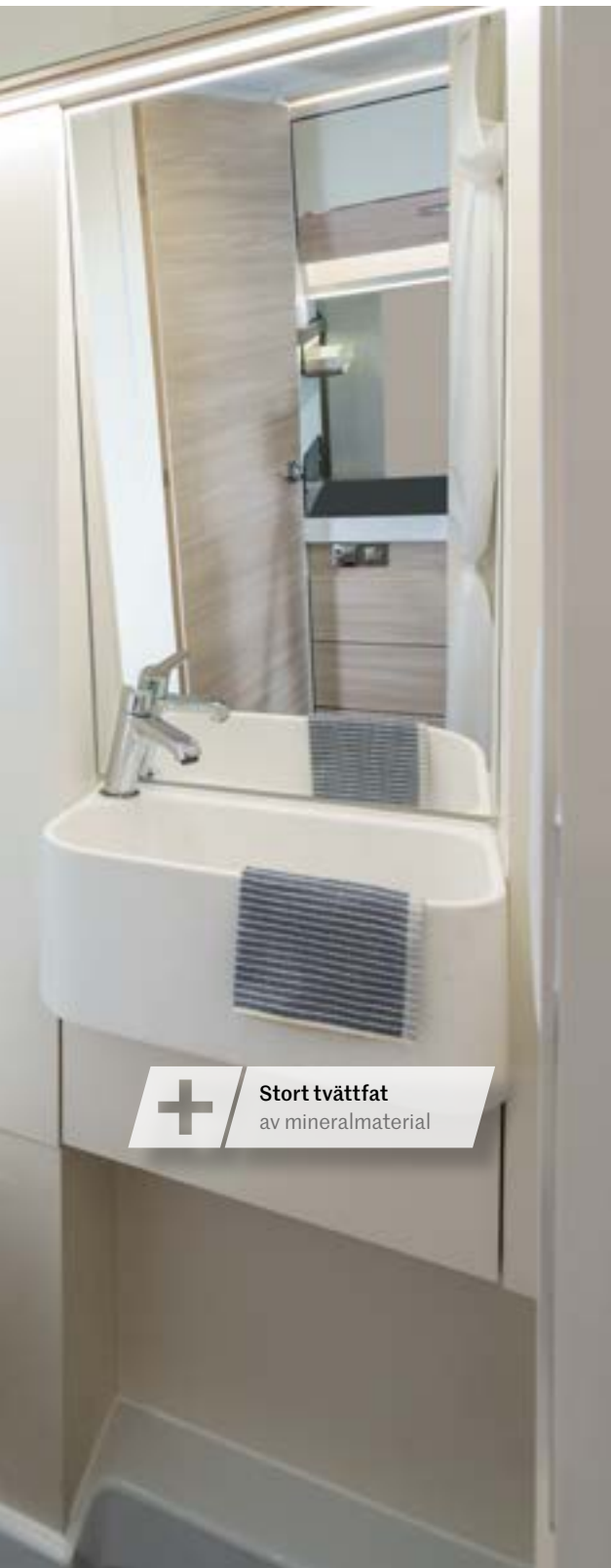
+ Stort tvättfat av mineralmaterial