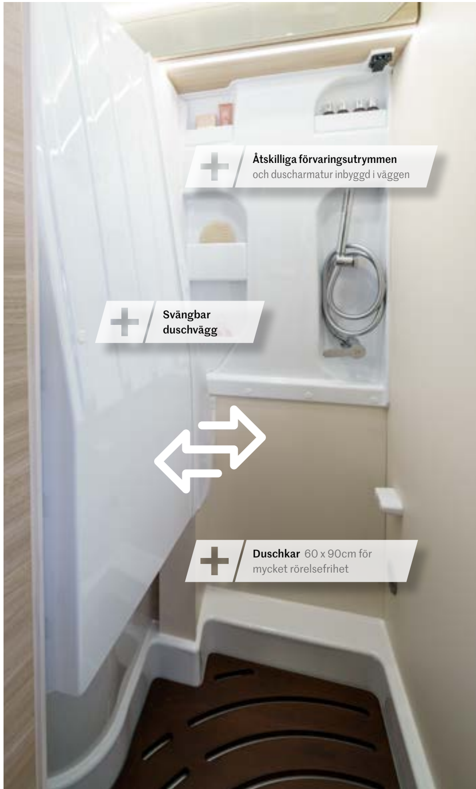
+ Åtskilliga förvaringsutrymmen och duscharmatur inbyggd i väggen