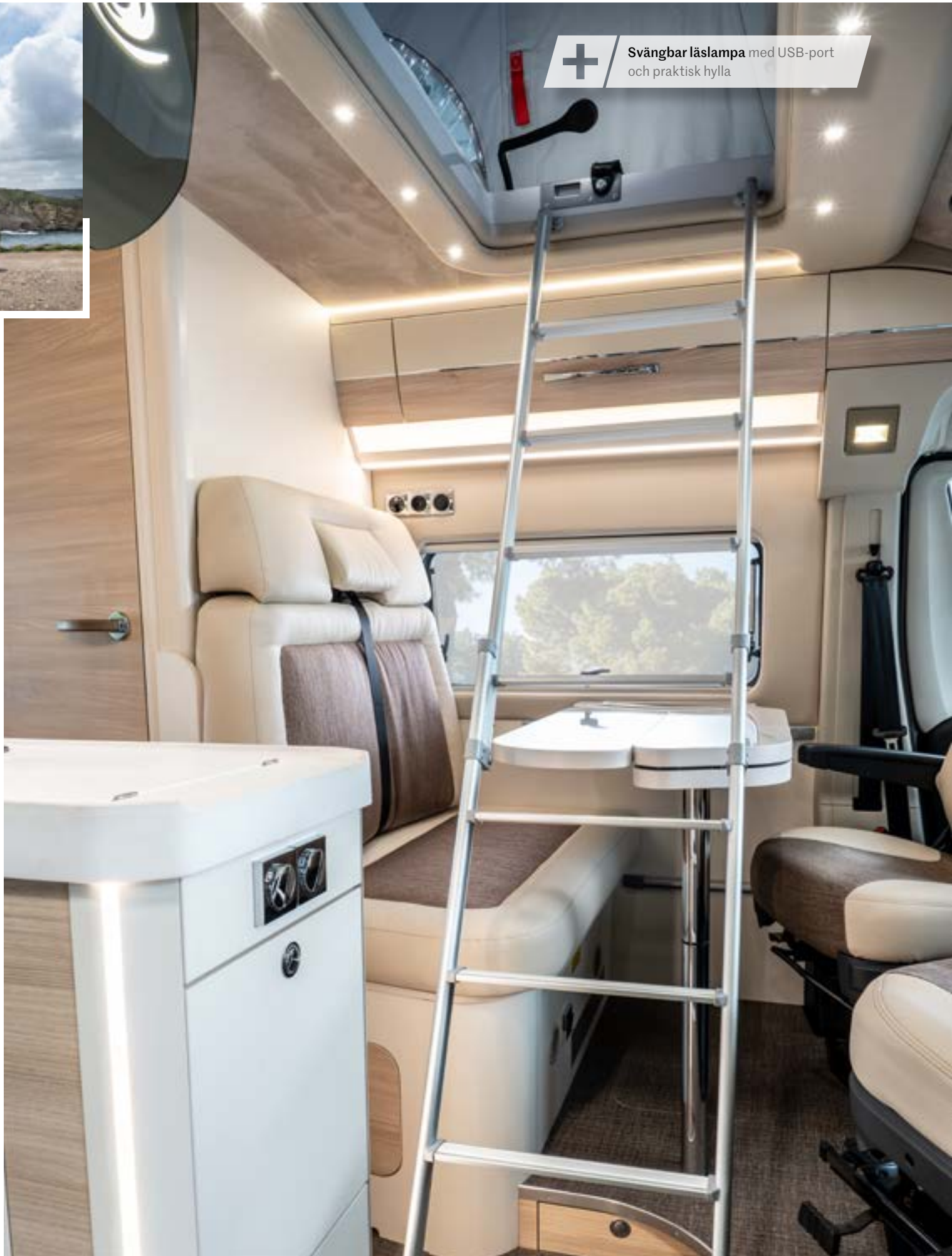
+ Svängbar läslampa med USB-port och praktisk hylla