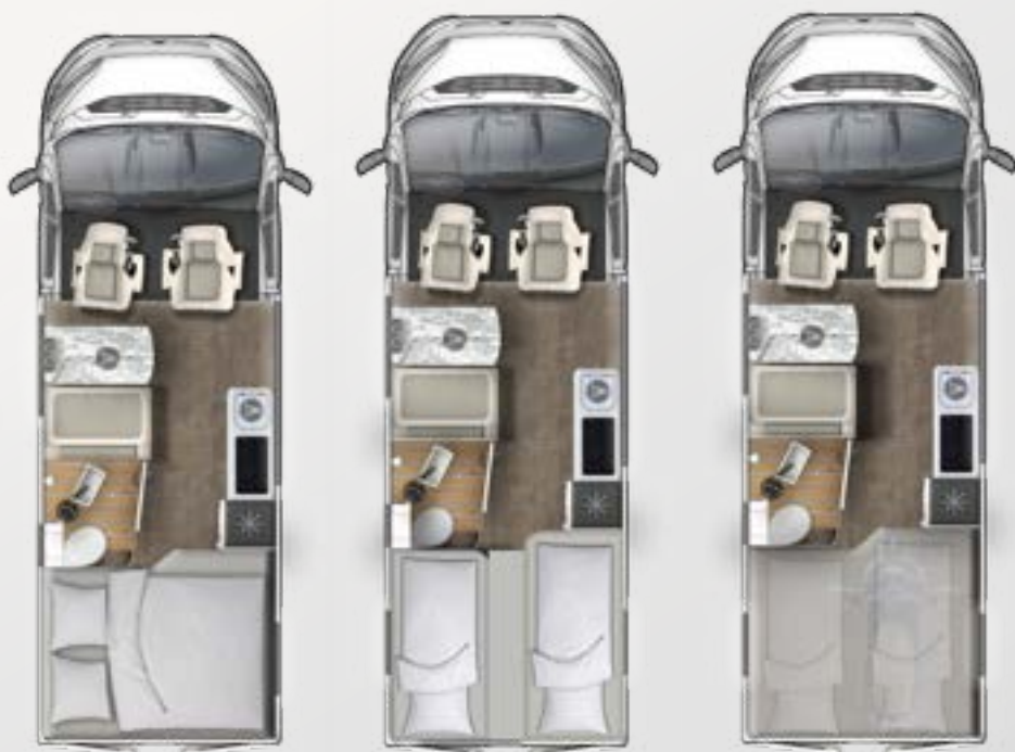
V 595 HB