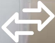
+ Sprchová vanička 60 x 90 cm pro dostatečnou volnost pohybu