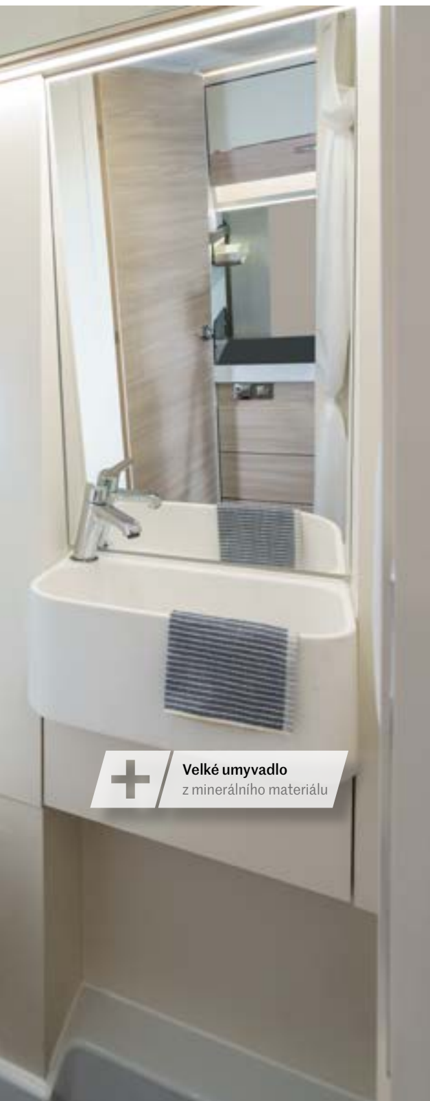
+ Velké umyvadlo z minerálního materiálu