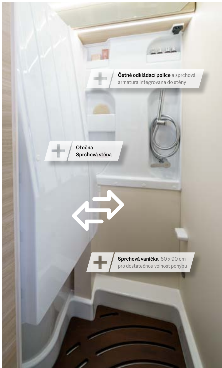
+ Četné odkládací police a sprchová armatura integrovaná do stěny